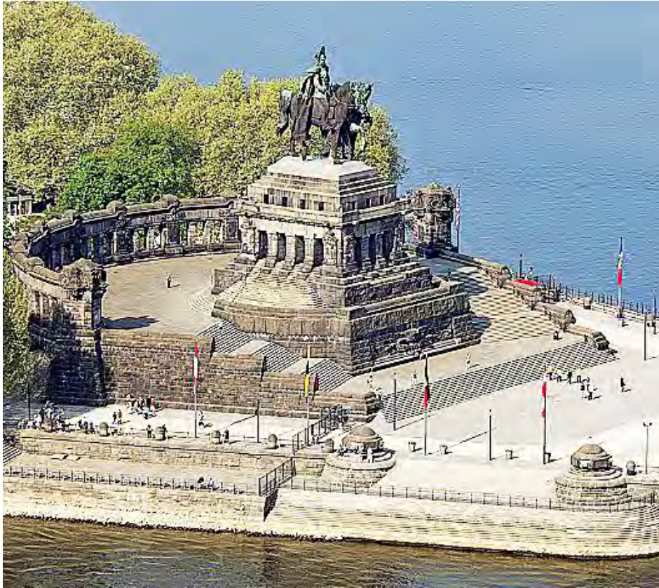
Deutsches Eck Koblenz