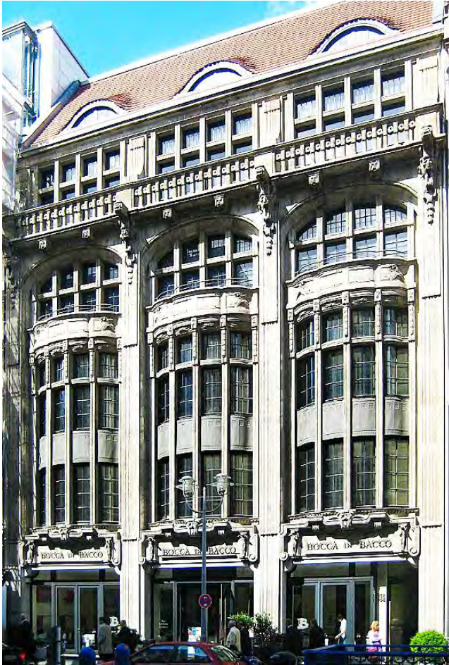
Geschäftshaus „Automat“ Berlin