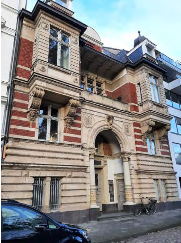
Düsseldorf, Inselstraße 26