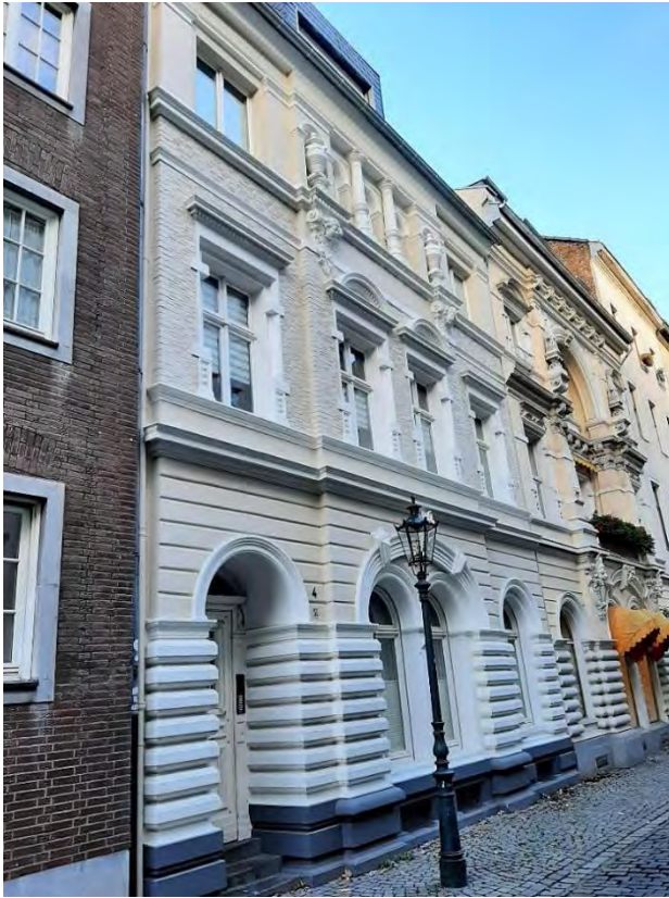
Düsseldorf, Lambertusstraße 4