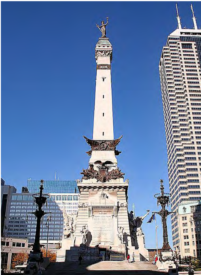
Monument Indianapolis (USA)