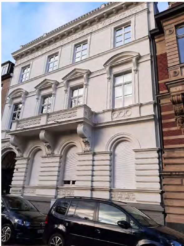
Düsseldorf, Inselstraße 27